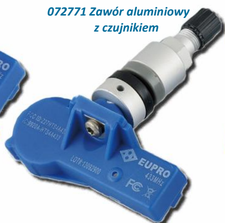
072771 Zawór aluminiowy z czujnikiem