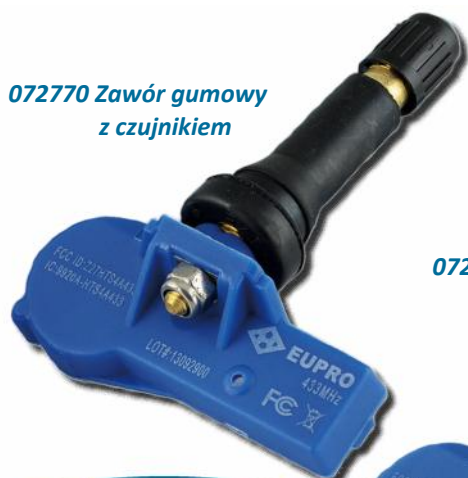
072770 Zawór gumowy z czujnikiem